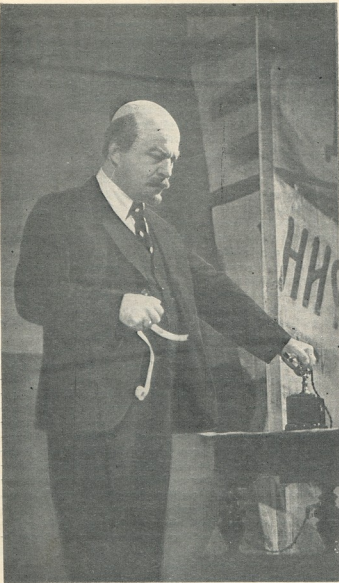
ვ. ი. ლენინი — ლ. დელაშვილი. (ქუთაისის ლ. მესხიშვილის სახ. თეატრის სპექტაკლიდან «ექვსი ივლისი».)

დასვენა, რომ „კარბონი უნდა დაიქცეს“ აბა, დამიბტ- კიეთი, რომ ვცადები.